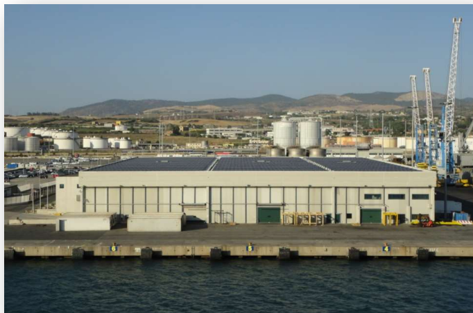
Foto del capannone CFFT con l'impianto fotovoltaico sulla copertura